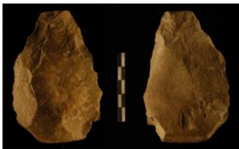
Cueva Negra: hacha de mano bifacial

Sesión 1ª del 28 de junio al 19 de julio, 2019